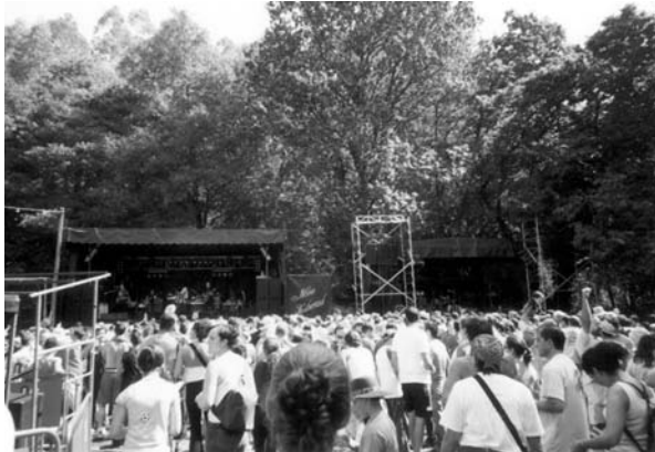
A xente nel prao da festa