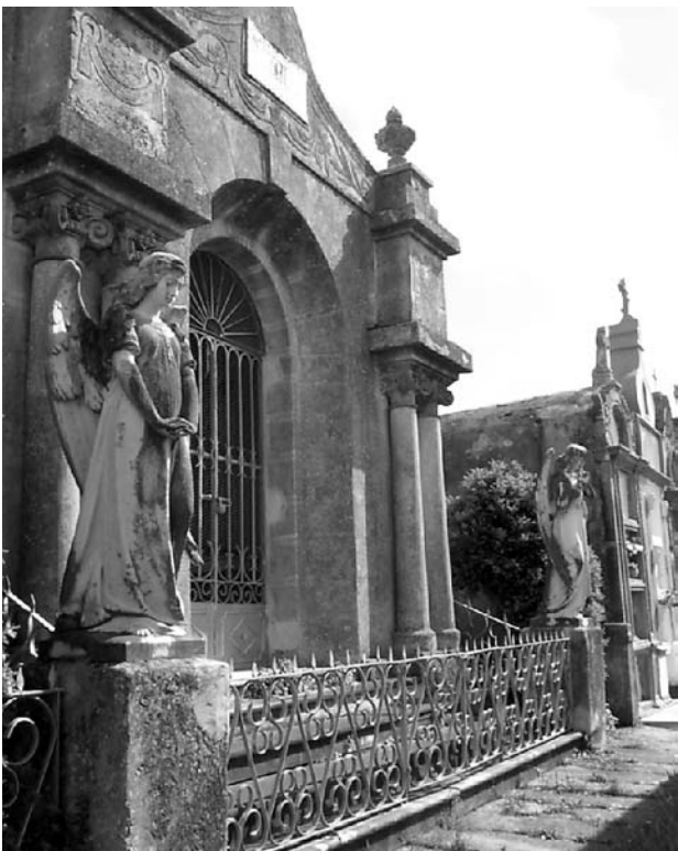
Panteón de Doña Socorro nel cementerio das Figueiras

Tras us anos, Socorro decide construír úa casa nas Figueiras, y d'ei a construción dos chalés col sou magnífico xardín inglés, as súas vistas á Ría, a