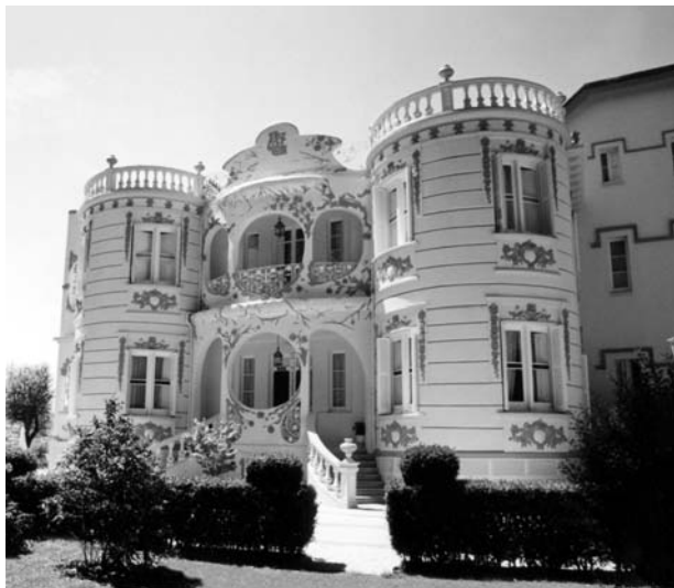
Úa vista da fachada posterior del Palacete, obra del arquitecto Ángel Arbex feita en 1912.

Nel ano 1981 Avelino y Fina, que xa levaban daquela el Restaurante Peñalba, compran el qu'agora ye chamaban Palacete Novo —col qu'el tempo fora más indulxente— y fain nel antiguo chalé el Hotel Palacete Peñalba, del que seguro xa ouguistes falar. Hai cinco ou seis anos, compran tamén el Palacete Veyo y súmanlo ás súas actividades hosteleiras.