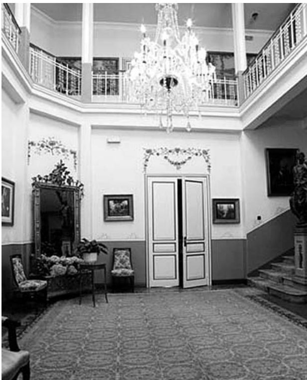
Interior del «Chalé de Doña Socorro».

que, a dicir verdá, en parte utiliza pral beneficio da nosa parroquía.