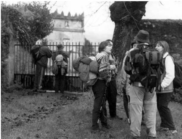
Delante del Palacio do Pibidal

Deixamos el barrio do Pibidal y, en vez de seguir hacia el ilesia parroquial de Santiago, hemos coyer pola carretera que vai a Guiar subindo hasta Refoxos, poble da parroquia d'Abres que ta situado núa pequena planicie a 80 metros d'altitú y a 7 kilómetros da Veiga.