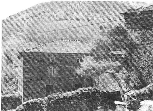
A Casa de Xancolás, na entrada de San Cristobo