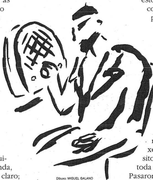
Dibujo: MIGUEL GALANO