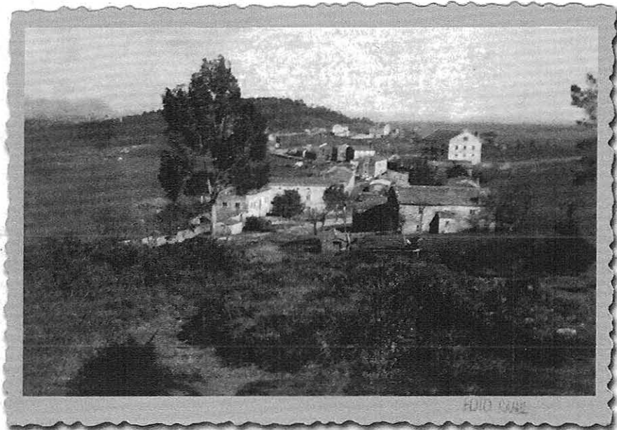
A Roda a empezos dos anos vinte