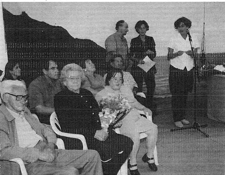
Un momento da entrega en Tapia del "Requesón de honor" 1999 a tres personas da Roda

Podemos seguir el noso recorrido cuntando, poño por caso, lo que nos costó a os da nosa edá desfernos dos nosos costumbres, as penurias que tuvemos que pasar pra evolucionar, pra cambiar: deixar de llabrar trigo y meiz. Pensábamos qu'íbamos morrer de fame os que nun tíamos medios pra modernizarnos y poñernos á altura dos demáis. Créditos nun los podíamos pidir porque nun tíamos con qué responder y muitos tuvemos que cambiar de trabayo y deixar a llabranza pra poder xurdir hasta chegar á