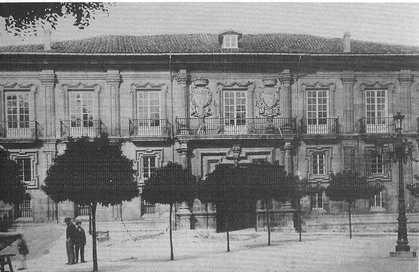
El Palacio de Trelles, hoi conocido como Palacio del Duque del Parque

cilia. Eiquí casóu con úa muyer da nobreza del isla de Sardeña, Teodora de Alborno, marquesa de Torralba y Borromeo. Premiao col hábito da Orde de Santiago, enviadóu despós quedando con úa fiya. Volvéu casar llougo con outra muyer de llinaxe, con Isabel de Agliata, duquesa del Parque y princesa de la Sala. En 1652 volvéu pa Nápoles como rexente del Consejo, posto que deixaría por outro más importante, el de rexente del Consejo Supremo d'Italia durante once anos.