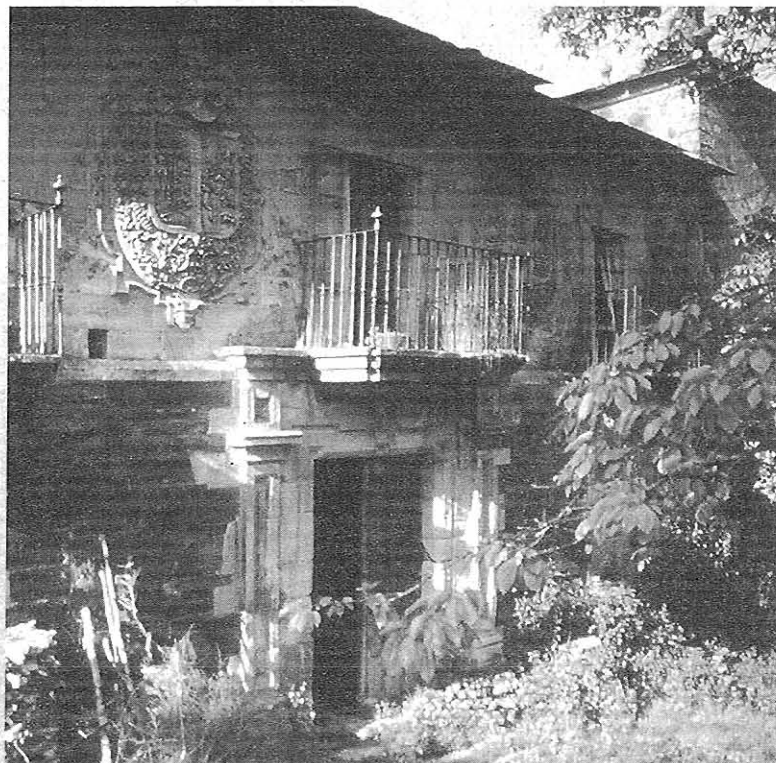
El palacio de Mon nel conceyo de Vilanova d'Ozcos