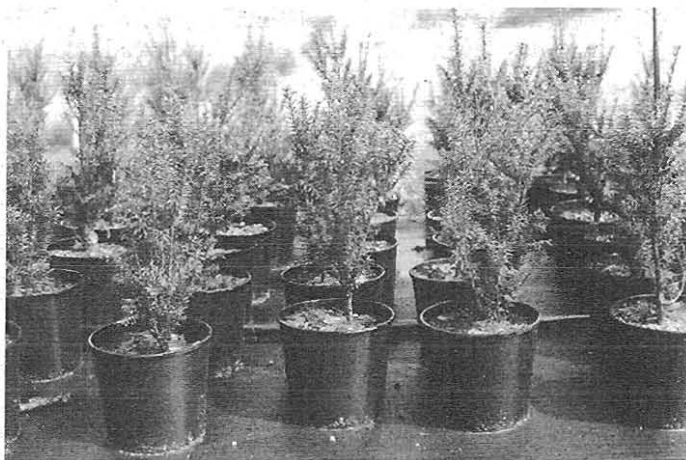
Teixo llabrao en viveiros

Os teixos chegan a durar máis de mil anos y a ter máis de dez metros d'altura. Afáinse a cuase todas as terras, sempre que nun s'enchumacen, y gústayes que teñan muita materia orgánica y que nun yes falte cal.