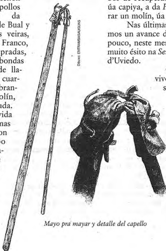
Mayo prá mayar y detalle del capello

Por eso, esperamos qu'a xente s'anime a darnos ou cedernos esas ferramentas que xa nun yes mandan nada y que muitas veces tán desféndose esquecidas en dalgún cabanón. Nun podó deixar d'estimar todas as axudas que vou recibindo nestos anos y, en especial, quérome acordar del asociación cultural bualesa El Penedo Aballon , na qu'eu tamén tou metido y cua que comparto ilusióis y trabayo.