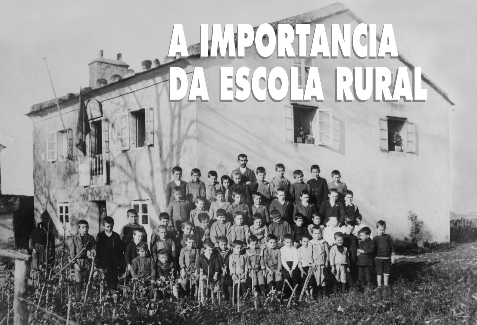
Escola nel conceyo del Franco (c. 1916).