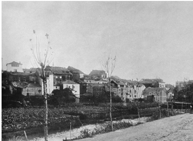
Úa vista de Navia dende El Espín

En 1932 pintan Navia como úa villa moderna, con alcantarillao, traída d'augua potable, lluz eléctrica ya firme muito bon nas cayes. Ya dícese, pa ben, que temos teatro-casino, cafés, sitios unde dormir los que vein de fora, comunicacióis de telégrafo ya teléfono, médicos, farmacias... Por outro llao, Automóviles Luarda S. A. fía xa naquellos tempos viaxes a Xixón, Uviéu, A Coruña, ya outros llugares más pequeníos que volaban de camín a los más grandóis. Hai tamén