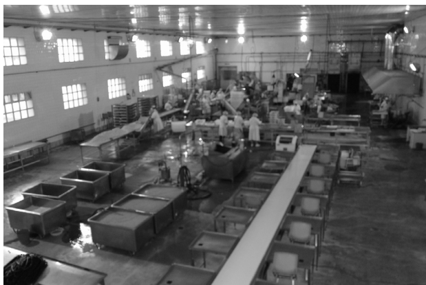
Un día de trabayo nas modernas instalacións da fábrica tapiega d'Albo

Os cambeos da fábrica nótanse a primeira vista, xa qu'hoi é toda d'aceiro inosidable y «podería decirse qu'é como úa gran cocía». Lo que si defende García é que «aunque el sistema de producción é industrial, son pratos naturales; así, por exemplo, os cayos límpianse a mao». As máquinas, como pasa sempre, restaron trabayo manual y mentras antias «trabayaban