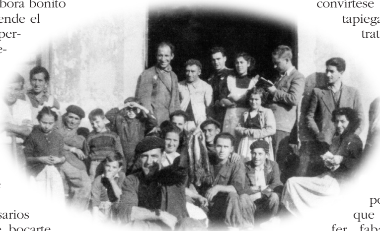
Os carrexadores que levaban el peixe hasta as fábricas, núa pouxa nel trabayo