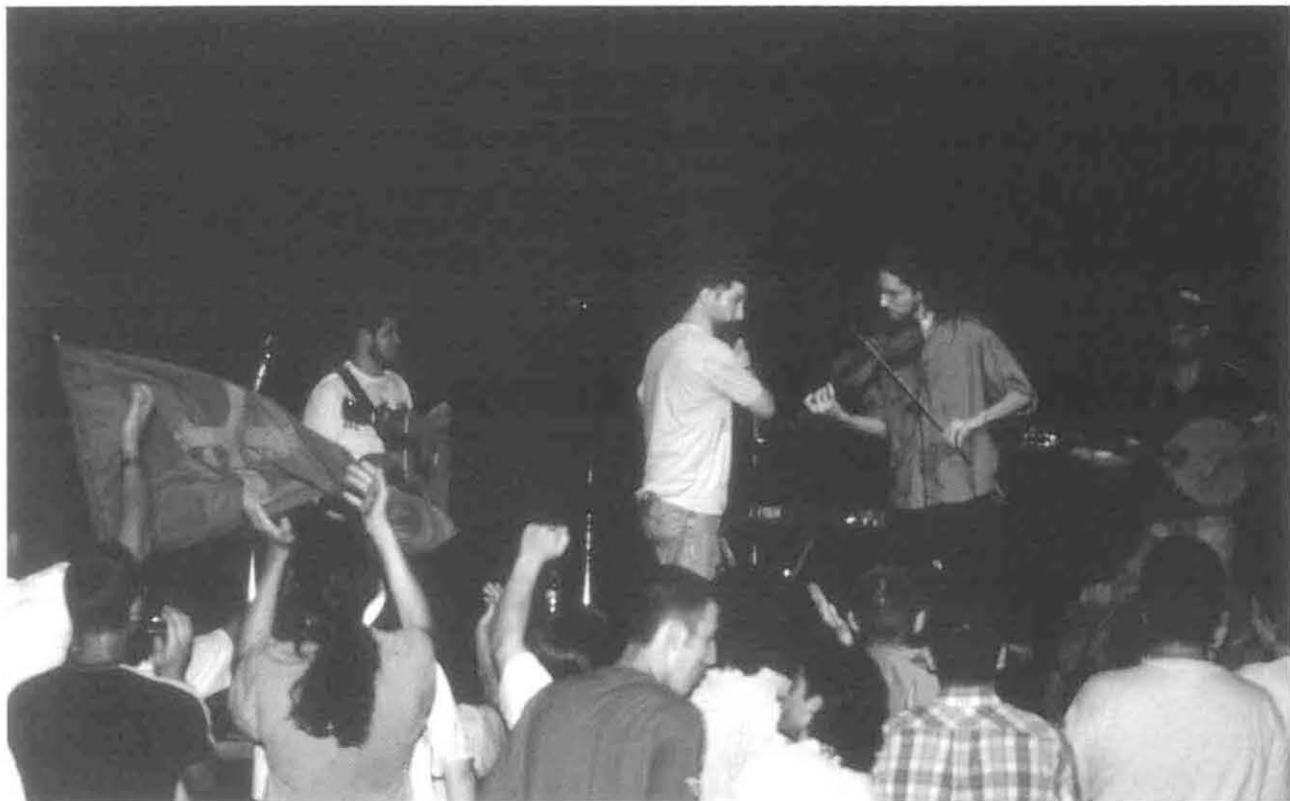
Llan de Cubel

qu'allí había. Un panorama de verdadeiro marabayo benhumorao que metería a tollura nel corpo a cualquier forasteiro que por allí s'arrimase, sorprendería a propios y estraños col aumento de fervor y luxuria qu'allí houbo y feiría botar as maos á cabeza a cualquier cura de corpos ou d'almas que se deixara caer por allí mentres duróu a estancia de Skolvan nel bar, hoi xa pechao, de Casa Queitano.