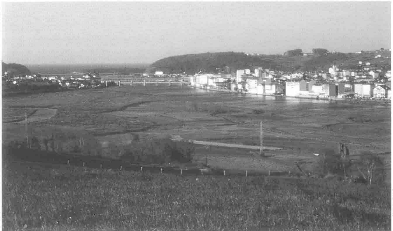
Navia é a capital funcional del noroccidente asturiano

En pedrazos grandes del Valle, a xente cambiou da-feito el paisaxe; aproveitando as vertentes costedas y a pedra impermeable fixéronse os embalses. Asina, atoupamos el d'Arbón, el más novo; el de Doiras ou Silvón, el más veyo, cuas casas dos inxenieros cerca, nel alto; y el de Grandas, el más grande, con restos del tempo da súa feitura al llargo de todo el Valle, como os pés del teleférico que se montóu pra llevar el material dende El Espín, ou como el poblao da Paicega,