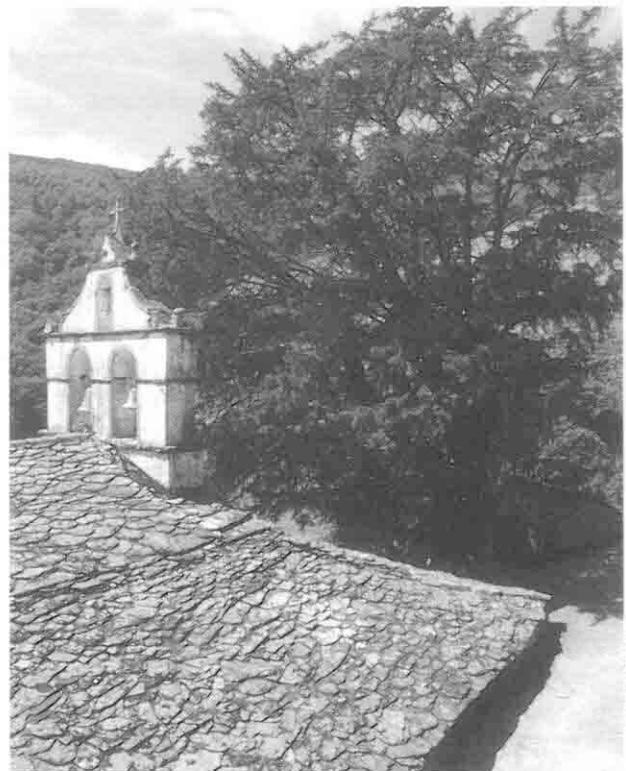
Igresia de Pastur (Eillao)

Por outro llao, muitas das edificacións dos llugares inda siguen sendo a proba del uso dos materiales que s'atopaban cerca. As paredes tán cuase sempre feitas cua pedra del llugar: llouxa amourazada, pedra ferrial, pedra de grao... As cubertas son de llouxas, ás veces con gouños tendo mao del augueiro y cruzadas nel corume, as marcacións son de madera de castañeiro ou carbayo, como as portas, ventás y contras nas casas, asina como a madera dos hurrios, os llistóis dos cabazos y dos cabanóis, etc. Nel recuerdo quedan os cabanóis con cubertas de meiza ou de rama de pino, heredeiras á súa vez das cubertas vexetales das casías dos castros.