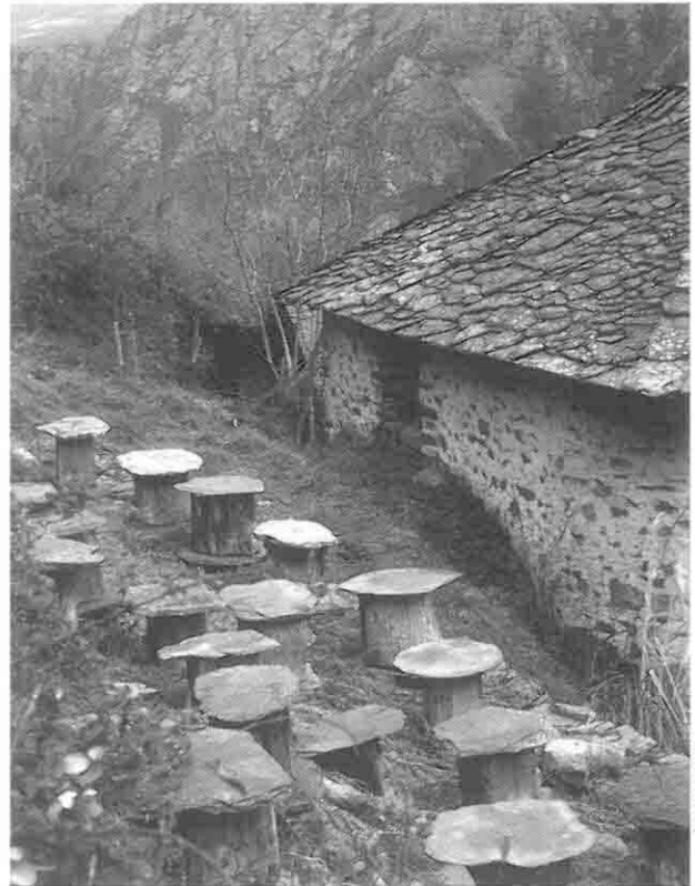
As abeyas son úa fonte de recursos

A entidá supramunicipal debería chegar a trabayar como un órgano de xestión unitaria, integrando el conxunto de mecanismos municipales y rexonales qu'operan nestos momentos nel Valle, hasta agora sin abonda coordinación y orientación pr'hacia el desarrollo integrao. Asina, habería de coordinar axencias de desarrollo local, servicios d'asistencia social, oficinas d'información xuvenil, telecentros,