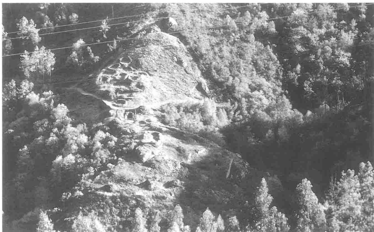
Castro de Pendia (Bual)

de Penouta, unde a pedra de grao é el material constructivo más usao, que choca nun Valle de pizarra y pedra ferrial. A cantidá d'elementos conservaos y os contrastes nel arquitectura y nel poblamento tradicionales dan riqueza al Valle.