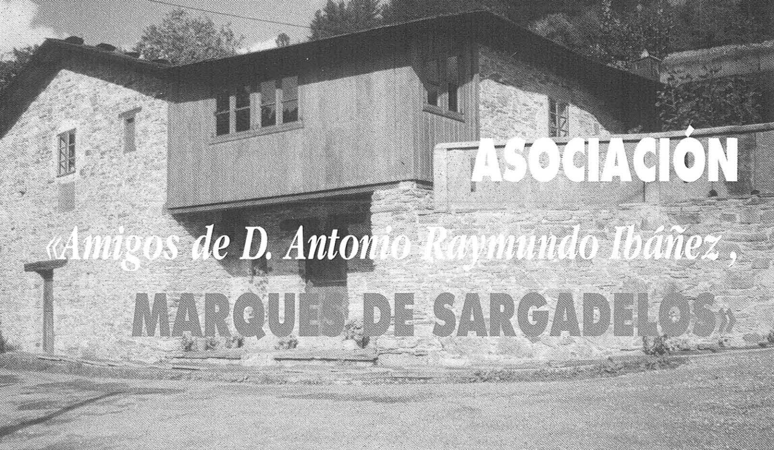
A Casa d'Ibáñez, unde ta el museo y el local da asociación