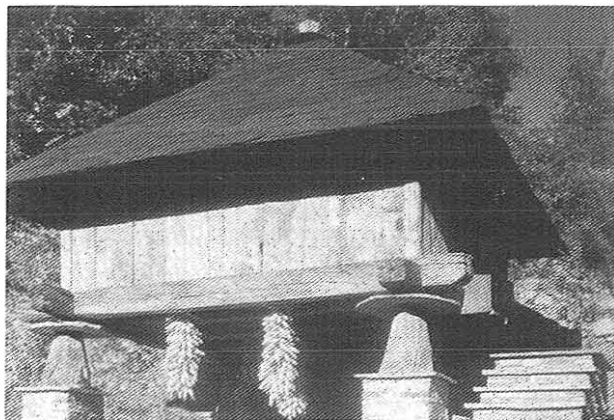
El borro da Casa d'Ibáñez

Os retratos máis que valorar un feito concreto levan el fin de facer úa carpeta con miras ás xentes amigas que veñan detrás. ¡Quén sabe se pra dentro de cen anos xa nun urdíu algún inxenioso hidalgo,