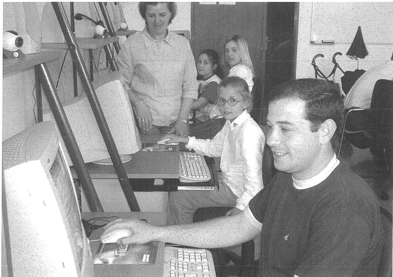
Rapaces d'ibias nun taller dos muitos que se poden seguir nos telecentros

ba os sous negocios y mantíase en contacto electrónico cúa familia, pero el outro, de máis de setenta anos, nun s'estrevía a mandar él mesmo os correos. Al cabo, deu el paso... y acabóu embizcándose.