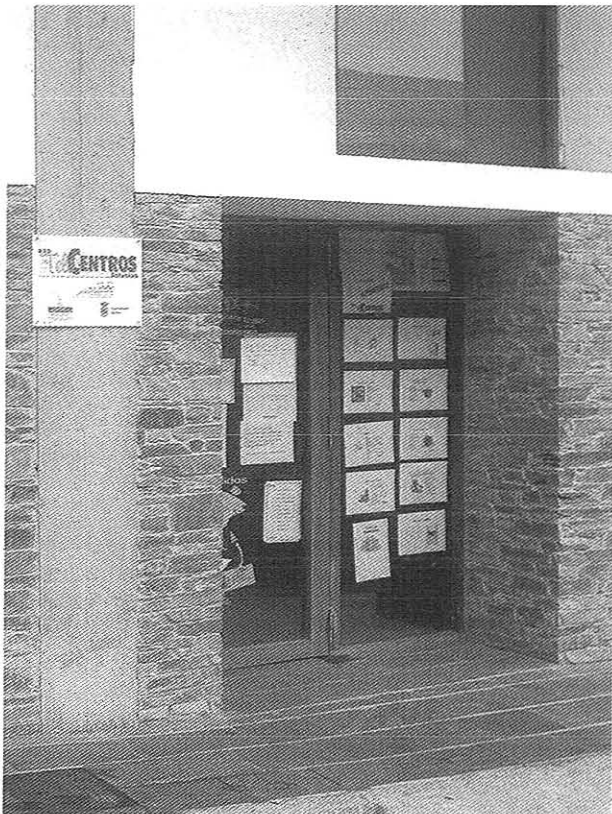
Exterior del telecentro en Santantolín (Ibias)

Y é que son os nenos os primeiros en entrar a sabichar nel telecentro porque los chama a novedá y a posibilidá d'atopar sitios novos unde entreterse. Però a función principal d'estos sitios é a formación y todos os axentes encargaos dos telecentros procuran ir llevando a os rapaciós das posibilidades d'ocio que brindan os ordenadores ás posibilidades formativas. D'ese xeito, van tentando de qu'os nenos practiquen a mecanografía y amañen allí os sous trabayos escolares.