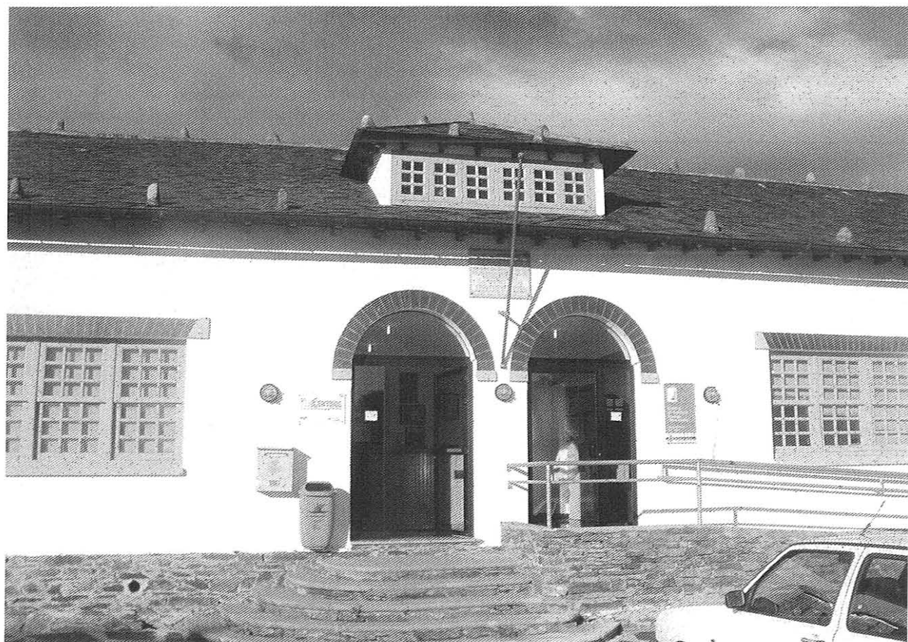
As escolas veyas del Rabeirón, en Ortigueira, unde ta el telecentro de Cuaña

Condo Tano chegóu había úa páxina web del Conceyo, taramundi.net . Al cabo de dous anos de telecentro, cuase todos os hoteles tein a súa páxina en Internet, y muitas pousadas y restauráis tein ou tán amañándolas. Nos artesanos, qu'é úa estaxa importante na economía taramundesa, el telecentro encontróu úa resposta muito búa y d'este xeito puido axudalos nel que chaman "alfabetización dixital", querse dicir, aprender os rudimentos pra manexar un ordenador y pra moverse pola rede. En Internet puderon conocer recursos que yes podían ser d'utilidá y tamén siguiron abondos talleres.