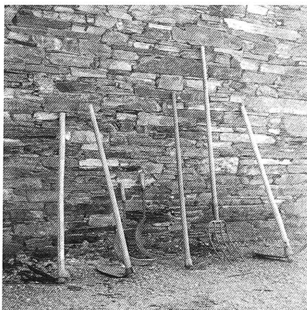
Roda, roda, fouciños, gadaño, gallada, da Casa dos Marinos

Aquelo era todo de labranza, vivíase d'ela, e algo de ganado. Labrar labrábase trigo, algo de centeo, avea, maíz, patacas, nabos, algo de remolacha e, no horto, berzas pró caldo e pros cochos, repolos, algún tomate, algún pimento e pouco máis. O traballo era ben duro, e todo chegaba a pouco porque, polo xeneral, ricos nun había máis ca unhos poucos e, inda así, nun se libraban do arado y o foucín. Eso si, traballábase todo o ano de Dios, cando labrando, cando sachando, cando arrendando, segando, arando, gradando, cuitando, e ademáis había que traer o mulido do monte pra estrar as cortes das vacas e do demáis ganado, levar a leña pró lume e pra cocer o pan, augua prá casa, e tantos labores grandes como pequenos. Ademáis había que cavar o monte pra labrar algo de trigo qu'axudara ó que se collía da