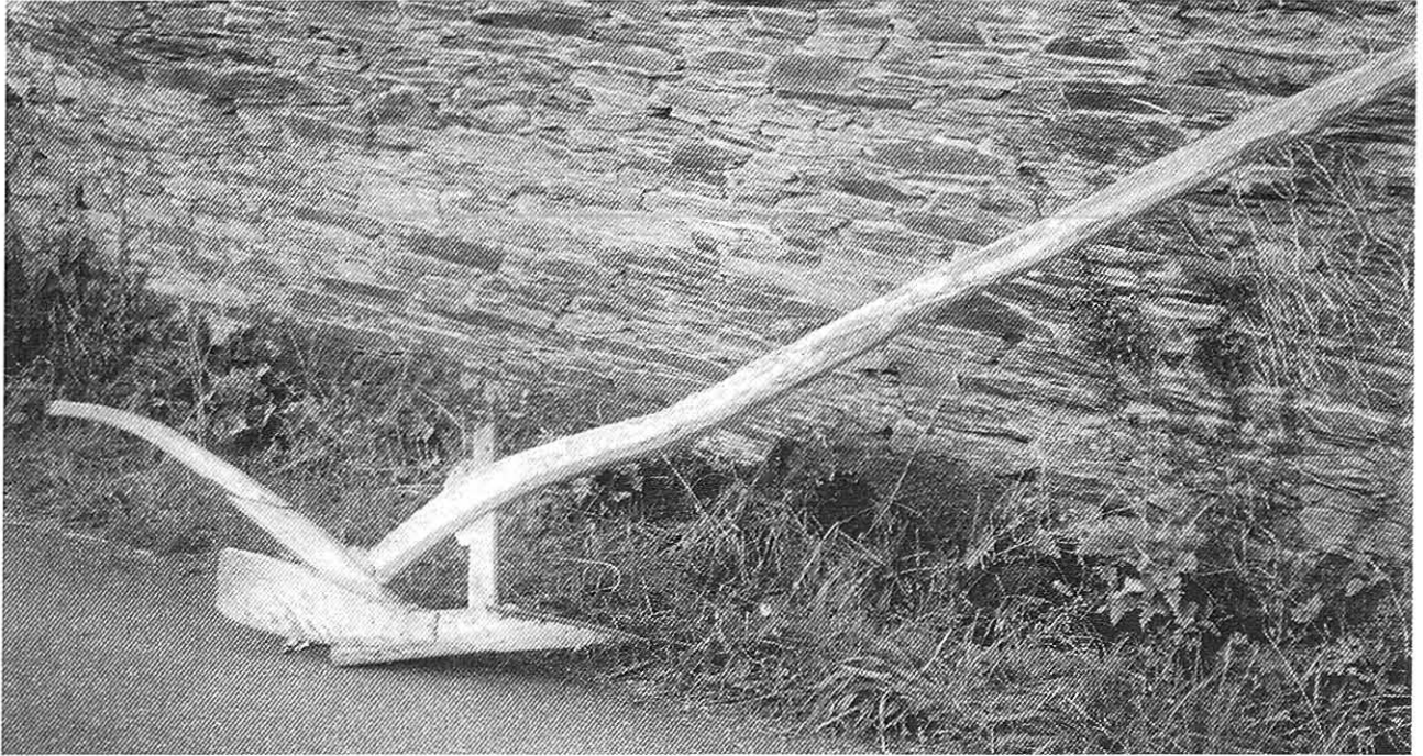
Arado d'orelleiras, de pao, da Casa do Torneiro

Ile coupesen as zocas nas canles e nun desbaratar os sucos. Cántas veces había xente que trollaba de noite, coa luz da lúa de xaneiro, xeado hasta os ollos, e máis teso ca un garabullo.