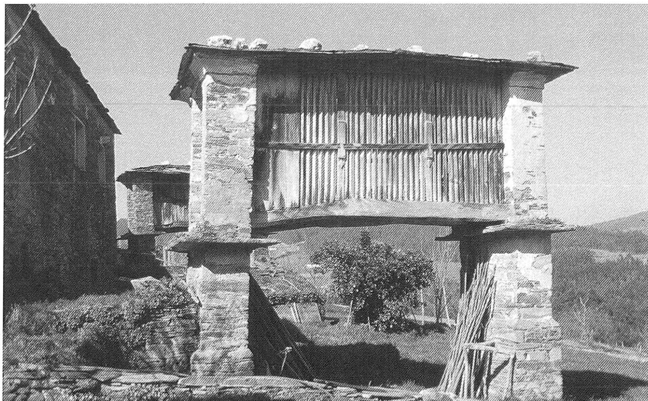
Cabozos da Antigua

terra, que nunca chegaba d'un ano pra outro. Esto se as terras eran propias, porque tamén se levaban arrendadas y había que pagar en trigo, en ferrados ou en tegos , según a cantidá, que —falando sempre en trigo— un ferrado era igual a dous tegos y un tego igual a seis kilos e cuarto.