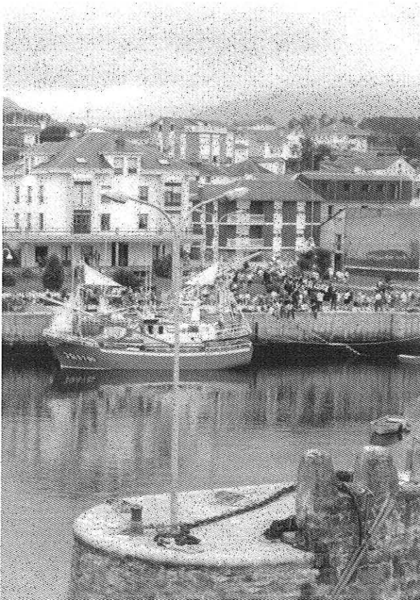
Úa vista del porto de Veiga (Navia)