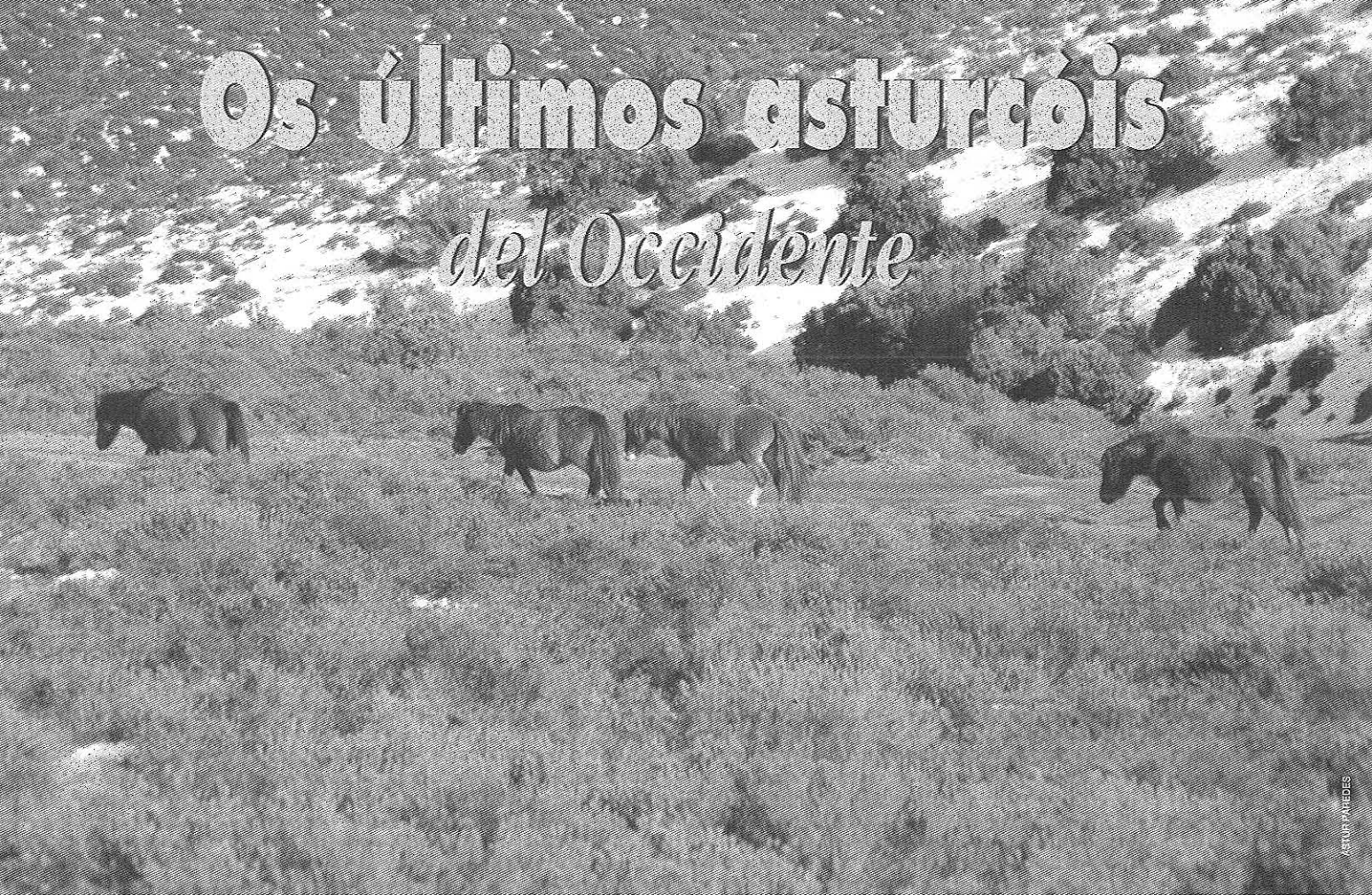
Burras na Serra de Penouta (Bual)