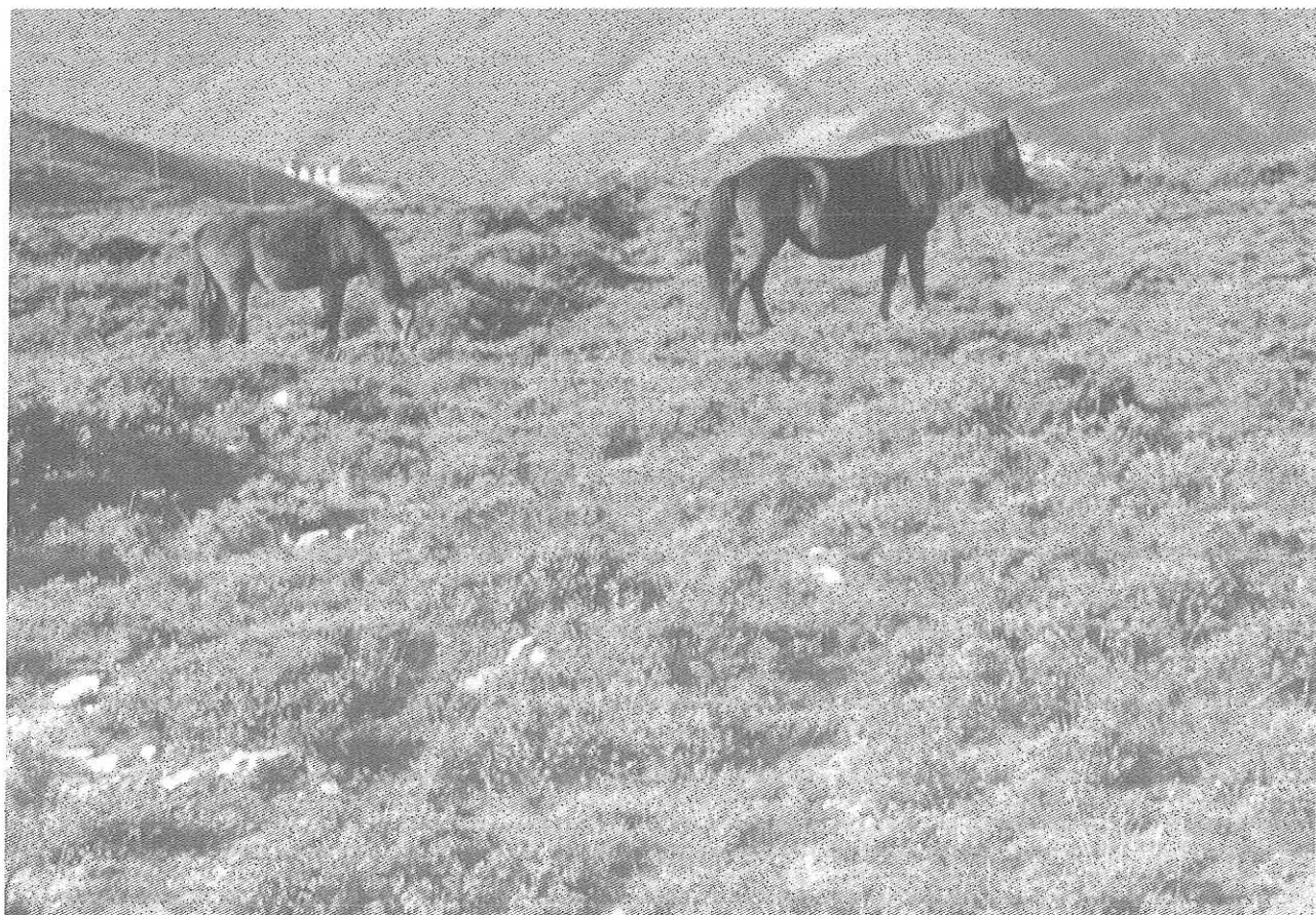
Burras na Serra del Palo, delante de Montefurao (Allande)

ciación que xestiona el llibro xenealóxico da raza dos asturcoís y esta negóuse á súa inclusión sin dar ningúna xustificación, supoñemos que por un criterio arbitrario. Informóuse da situación á Conseyeiría de Medio Rural y Pesca, aunque esta nun fexo máis que delegar nel ACPRA. Nesta situación levamos us dez anos y mentres tanto a poboación vai menguando cada vez máis porque nun ten ningúna protección.