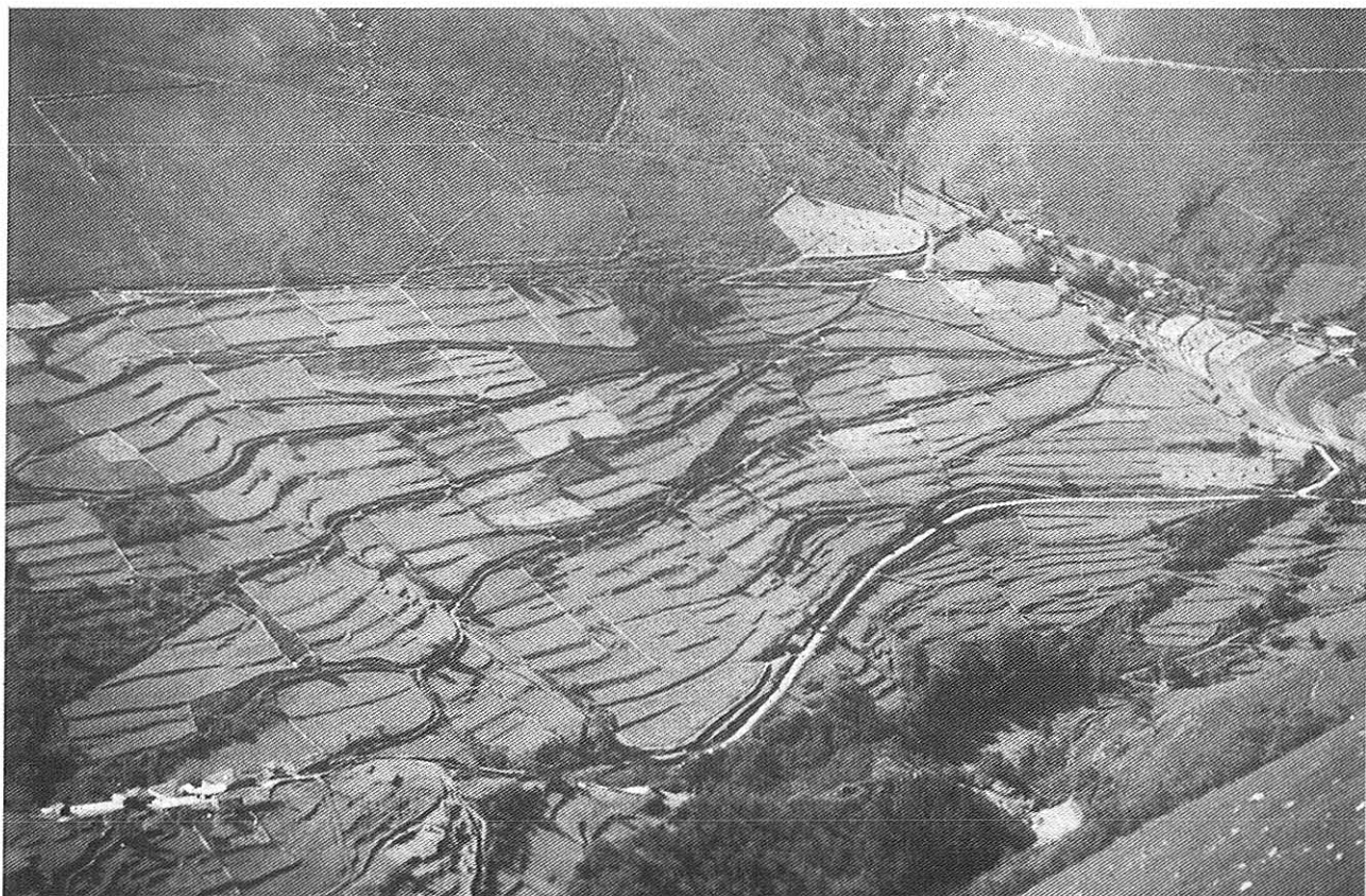
Úa vista del conceyo de Villayon dende Carondio.

Dende Enterríos buscamos El Pico Carondio, que s'ergue al E., na serra del mesmo nome, fendo de fronteira natural entre Villayón y Allande. A serra ten us 11 km en dirección NE.-SO. Na parte que vamos andar nosoutros, us 3 km, hai varias serras con altos como Penasmolles, Peneos Redondos, Penacarneira, Penaforcada y El Pico Carondio (1.221 metros), con magníficas vistas y un buzón pra os montañeiros nel curume. Pra ir hasta él, primeiro baxamos a campa y