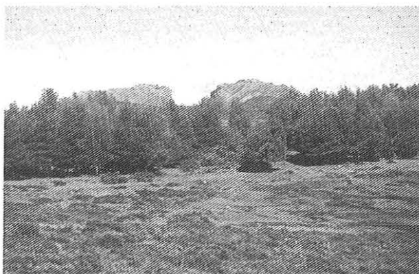
Cerca da Viega dos Abades

Deixamos con dolo esa montaña tan guapa y baxamos hasta as campas que la arrodían. Cruzarémoslas en dirección E. Pola nosa esquerda vere-