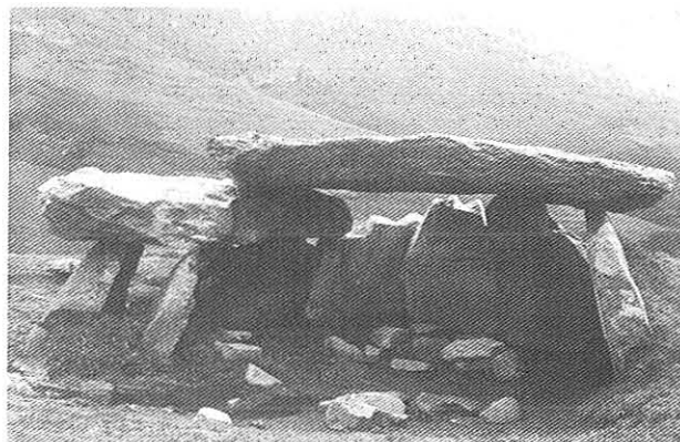
A Llastra da Filadoira, el famoso y máxico dolme ou tumba d'Enterríos

Desque acaba a arboleda hai que coyer un carreiro que sube pol medio del monte baxo nel que manda el toxo. Vamos ir subindo camín del alto d'Enterríos y vamos volver meternos noutro monte, esta vez de carbayos y fayas. Acabamos el tramo con árboles y subimós por úa serra cuase pelada, con toxos y gancelas como principal vexetación, y por entre ellos chegamos primeiro al Chao del Pino y lougo a Enterríos (925 metros). El sito conócese tamén como Entrevías y vén ser un paso alto y aberto entre as serras del Prao Roque (al N.) y Carondio (al SO.), cabeceira dos ríos Cabornel y Navedo, os dous afluentes del Río Navia. El sito é fronteira entre os conceyos de Villayón, Allande y Eilao.