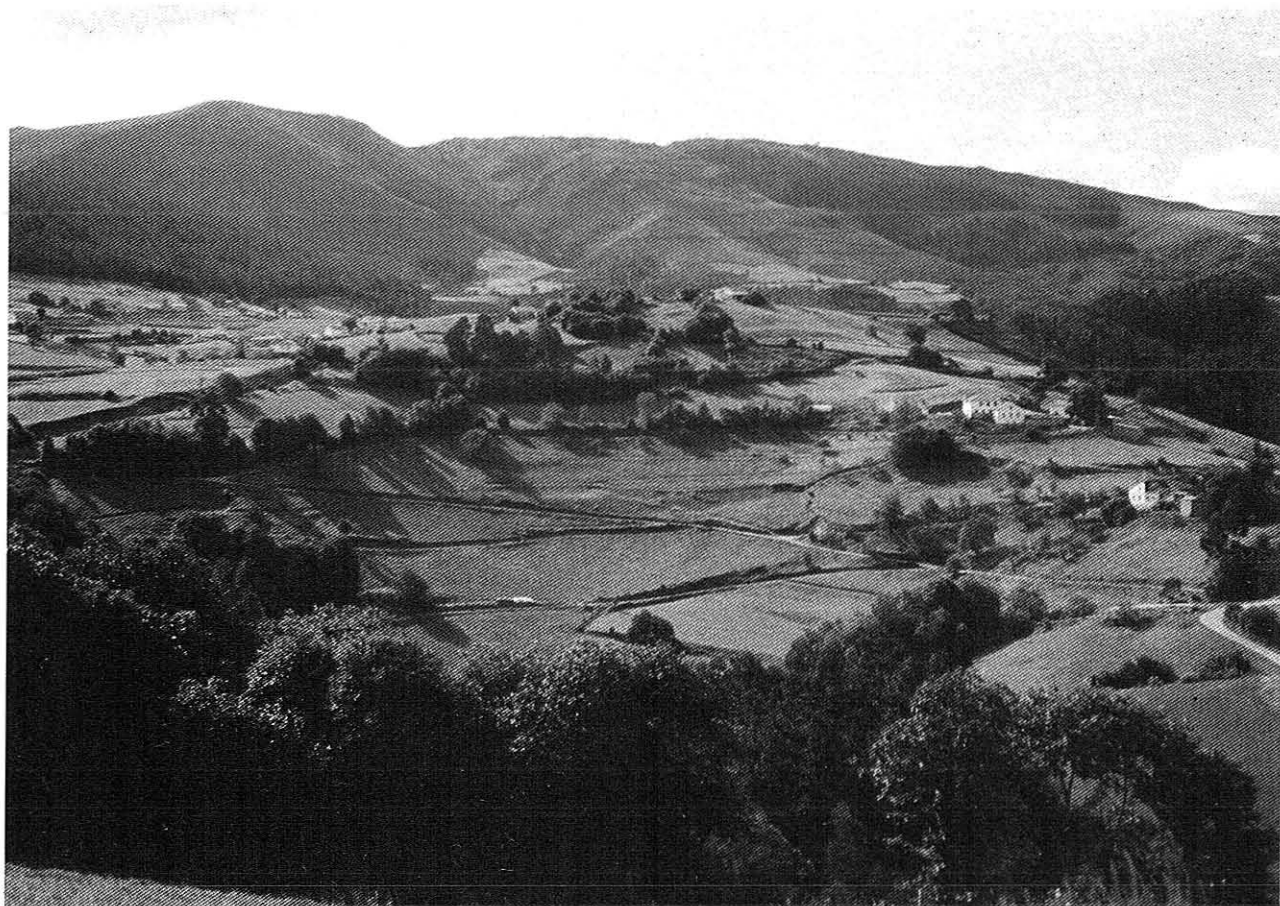
Os praos sempre verdes y os montiquíos al pé dos regueiros dominan el paisaxe da travesía

se pra que podan salir y entra esos homes con gao compraos con monedas d'ouro pola contornada, tanto nas ferias y mercaos como directamente a os vecí-os. Son os Encantos d'Andía, outros moradores máxicos das terras del Franco.