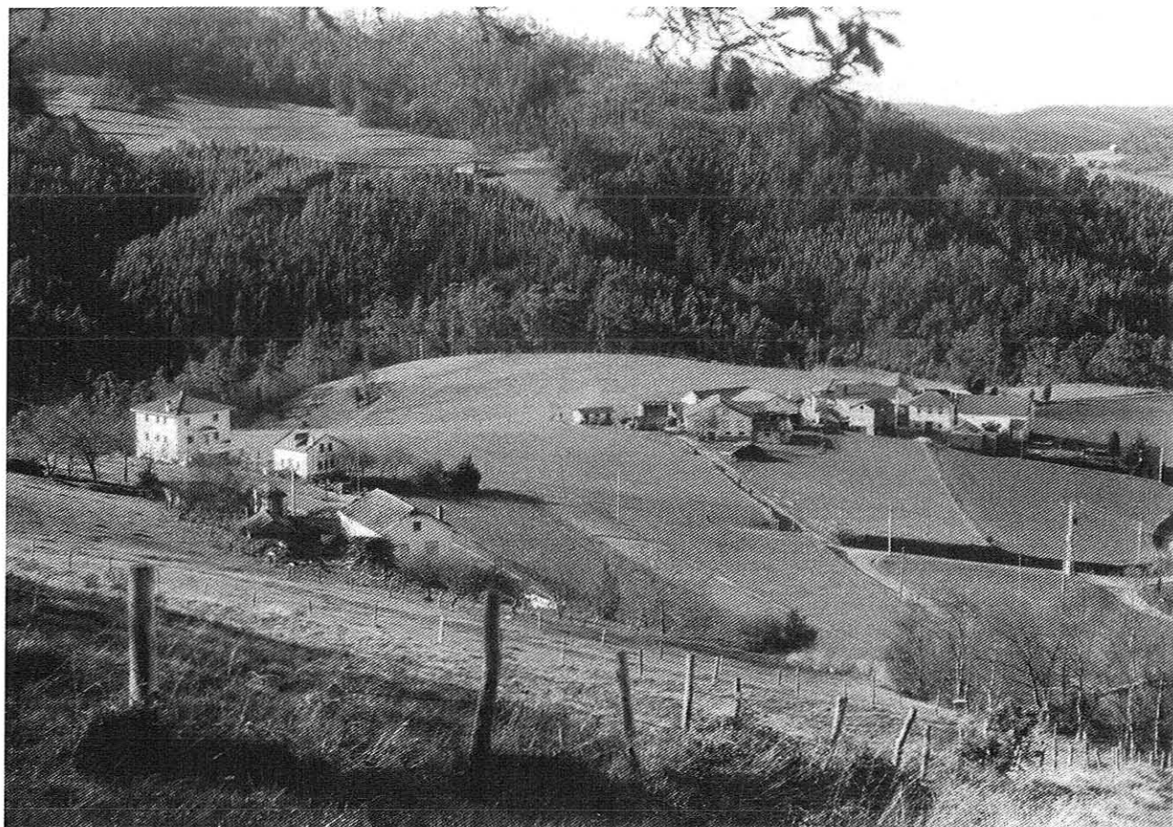
Vista d'Andía derriba del Llamazo

Hacia el SO., al outro lao del vale del Mazo y mirando pral alto, temos el monte del Rebouquedo, xa na parroquia da Braña, unde a lenda dice qu'a Capelluda da Braña (a virxe da Braña) y el Barbudo d'Arancedo (San Cibrán d'Arancedo), tiraron al nubreiro monte abaxo, antias de qu'este fixera úa das súas.