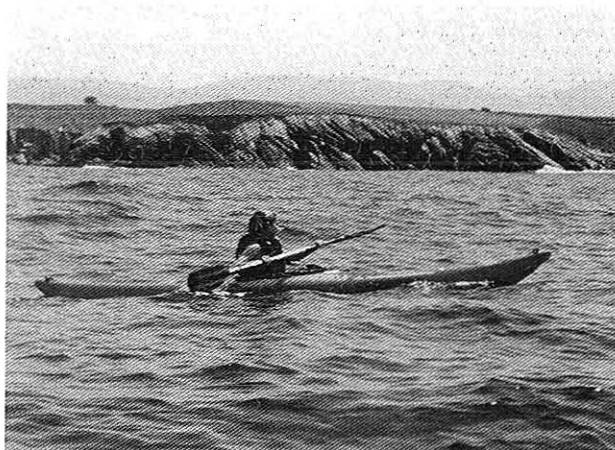
Un piragüista ben novo remando lonxe da costa

Os primeiros piragüistas xa veron os vernos de noite para montar as tendas de campaña no campo da