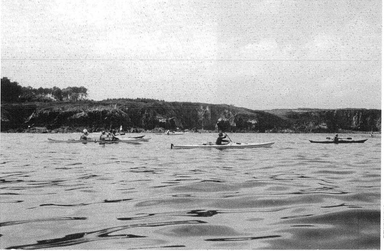
Os participantes delante das arribadas de Campos (Tapia)

praya, dende unde podían ter úas vistas impresionantes da costa y da desembocadura del Porcía.