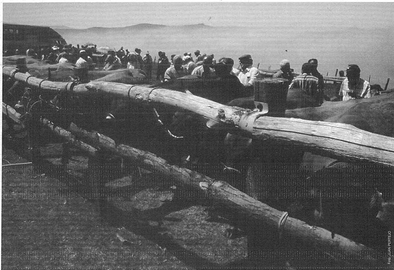
Os reses esperando a qu'os sous amos amañen trato

Metidos xa nel Monte da Curiscada, saco eu qu'el sou nome terá que ver con algún furado ou cavidad, igual con escavacióis feitas polos romanos pra sacar el ouro, que por eiquí hai mui ben d'elas.