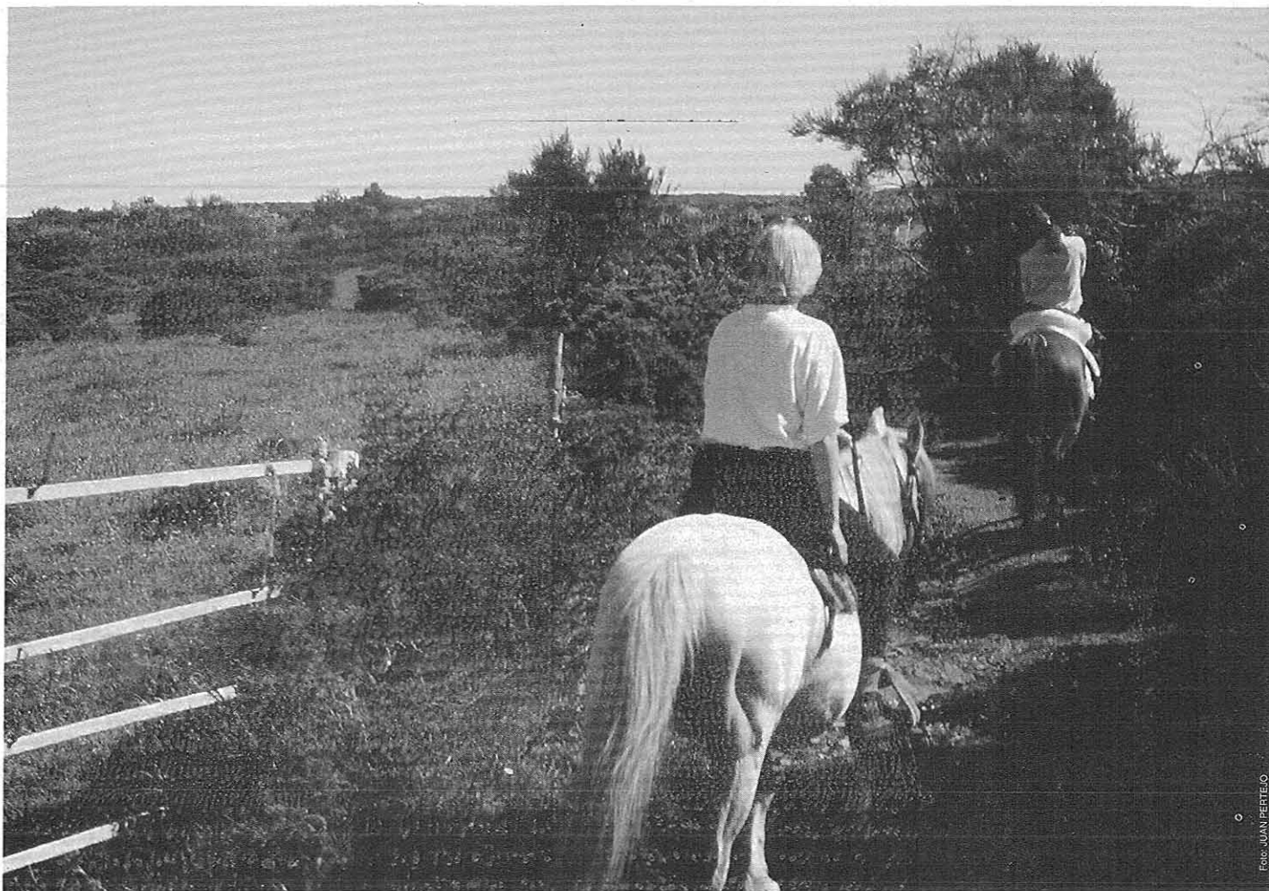
Nel Campo de Bixuiz, entre Penacova y San Cristobo

ver e de seguro qu'iba ter as posadeiras desfeitas en chegando outra vez al punto unde tábamos