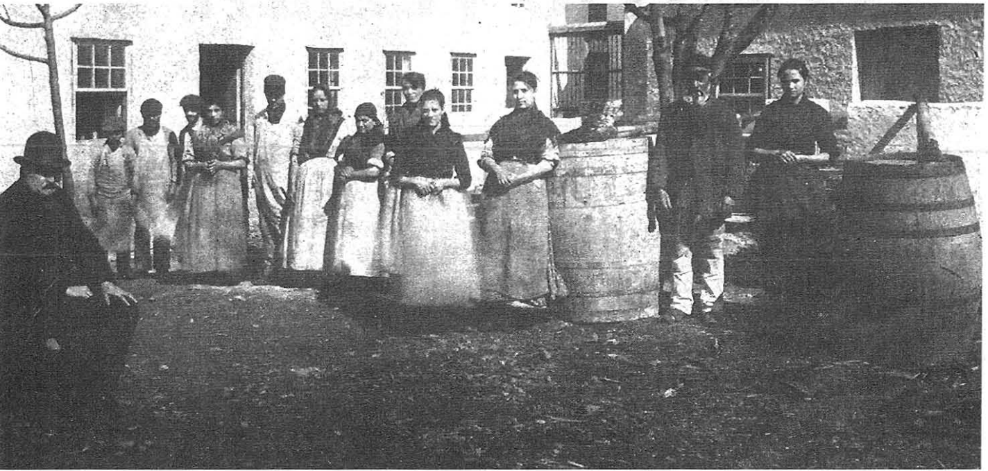
Trabayadores d'úa fábrica de conservas das Figueiras arredor de 1897

La Obrera brinda a os sous asociaos úa pensión diaria en caso d'enfermedá que vai, según el época, dende 1 a 2 pesetas, pra compensar el que nun entre el xornal na casa del obreiro. De primeiro queríase ir oumentando pouquín a pouco as dietas hasta chegar a cubrir a cantidá qu'el obreiro deixa de cobrar mentres ta malo. A práctica vai obrigar a poñer úa cuota fixa que col paso del tempo vai perder poder adquisitivo.