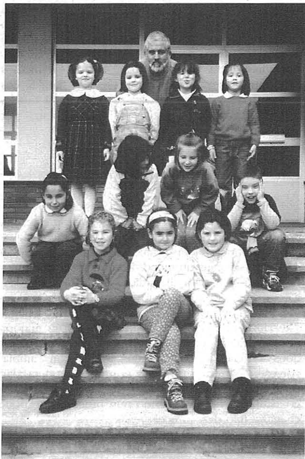
El maestro con dalgús dos sous alumnos

Todo esto fai qu'agora mesmo se teñan dudas acerca de poder estender a enseñanza voluntaria del galego-asturiano a outros centros del occidente d'Asturias. Este curso 1997-98 solicitaron galego-asturiano en Ibias pero nun se puido levar a cabo porque dixeron que nun había maestro cua titulación qu'esixía a Administración educativa pa poder impartilo. Pal curso que vén pode que pase algo aparecido porque nel Instituto de Navia xa solicitaron poder brindar al alumnado a asignatura. Però como en seis ou sete anos nun se fixeron cursos oficiales de formación de maestros pode que condo se pida xente pa impartir a enseñanza nun la haxa. ¿A culpa de quén é? Nosoutros pidimos úa y outra vez a os organismos que podían felo que se desen os pasos pa façilitar a formación dos interesaos y nun se fixo. ¿Por qué tanta desidia? ¿A quén favorece este desinterés?