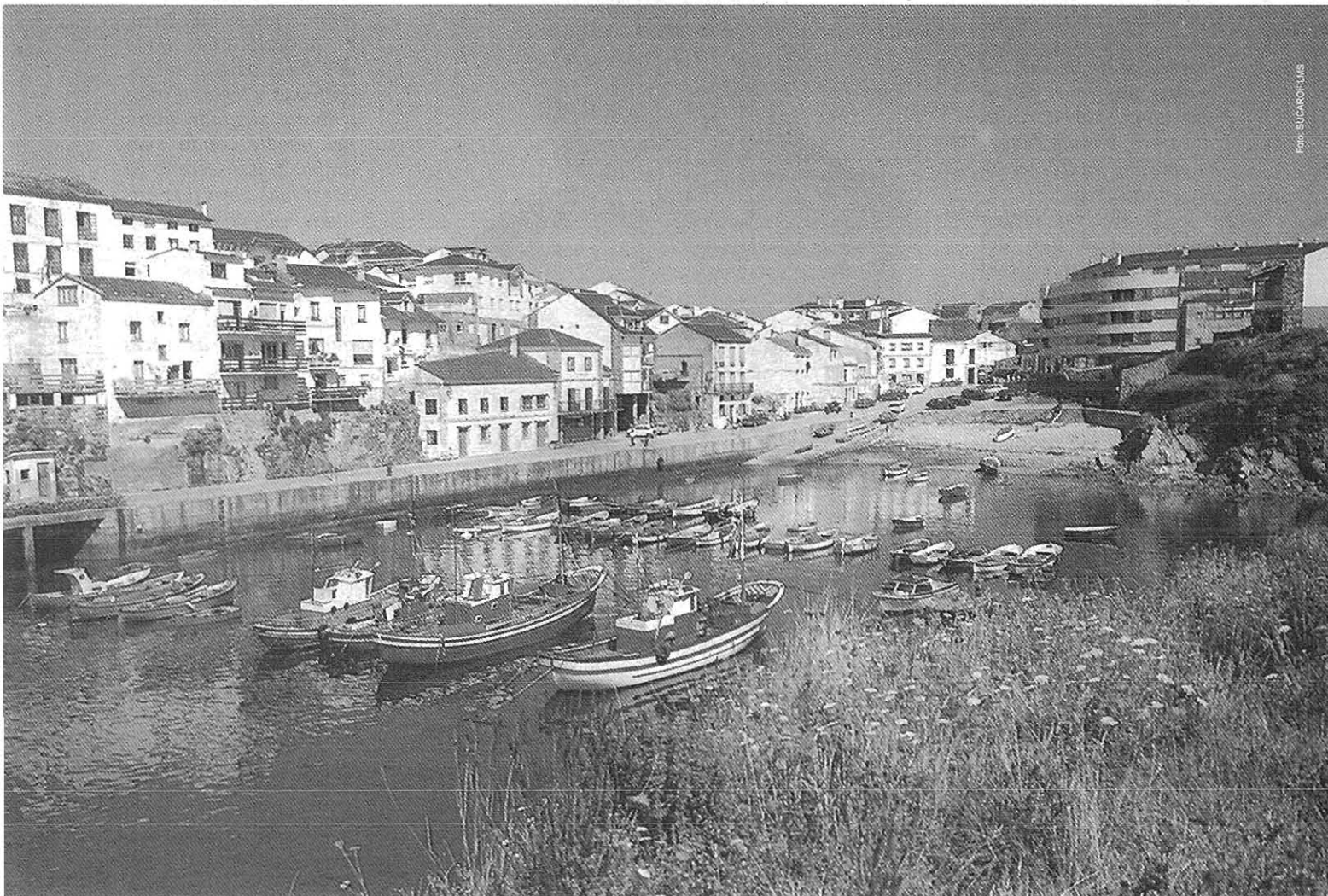
A Ribeira, col muelle y El Outra Banda á esquerda. Subindo pola dereta El Campo Grande, na parte alta de Tapia

Nun quixen perguntaryo porque xa lo sei, pro dizmo ela, y fálame a borbotóis del ano "d'aquela galerna" ou "d'aquel temporal" y de cómo "aquela noite" as muiyeres baxaban á ribeira "ás sabantismas", a ver si daquéen podería daryes algúa noticia. Y