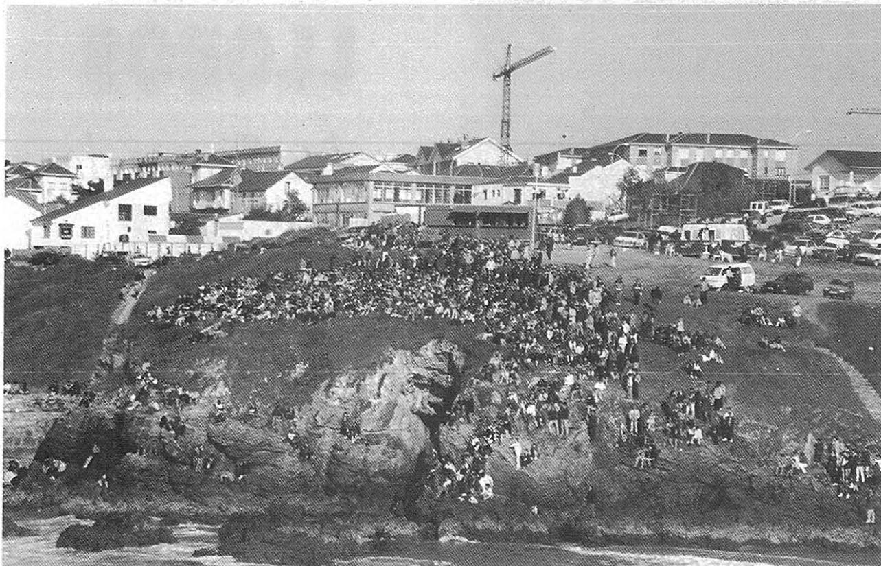
El Alto dos Campos chea de xente pra presenciar el Campionato de Surf de Tapia

búas prayas pa practicar el surf cerca da dos Campos, lo que deixa escoyer únde ir, dependendo das condicións del mar, del vento y das mareas. Pode dicirse qu'en toda a cornisa cantábrica hai infinidá de prayas y sitios bus pal surf. Nun falo de ningún porque se empezo a falar encho dúas foyas.